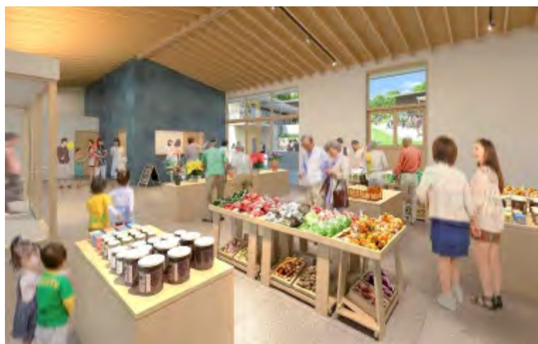
① コンシェルジュ棟：案内所、店舗