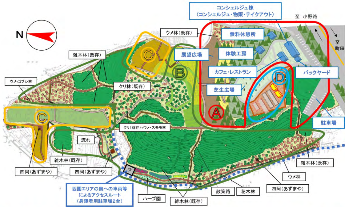
A : ウェルカムゲート B : 森林ゾーン C : 農園ゾーン D : 育苗ゾーン